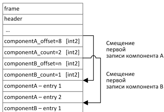
Рисунок 2. Схема сообщения с двумя повторяющимися компонентами

Повторяющимся компоненту или полю всегда предшествуют два поля — offset и count . Поле count содержит количество записей. Поле offset указывает на смещение (в байтах) первой записи компонента относительно начала данного поля; его значение не может быть меньше 4.